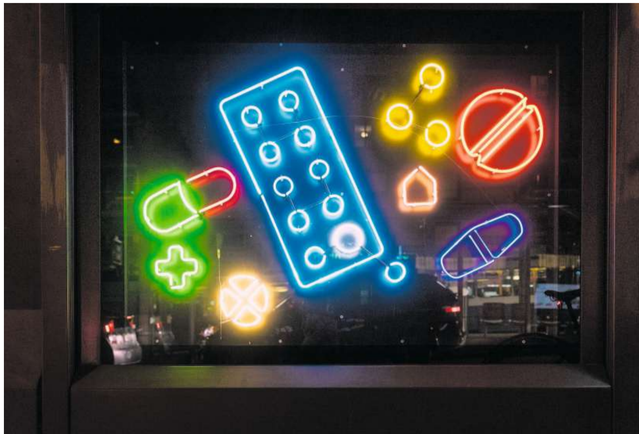
Für die Schweizer Spitzenmedizin bezahlen die Versicherten hohe Prämien.

Eine Initiative sieht vor, dass der Kanton höhere Abzüge für Krankenkassenprämien gewährt